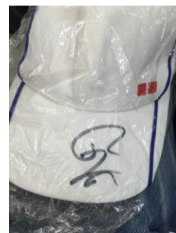
ナダル選手サイン入り帽子